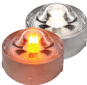
ไฟเลือกได้ 2 สี