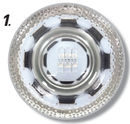
1. โคมกระจก ทำจากกระจกนิรภัย แข็งแรง ทนทาน