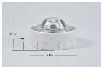
กว้าง \phi 11.3 cm ความสูงรวม 5.6 cm. ความสูงสำหรับฝังพื้น 4 cm.