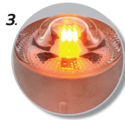
3. 6 หลอด LED ทำงานอัตโนมัติในเวลากลางคืน